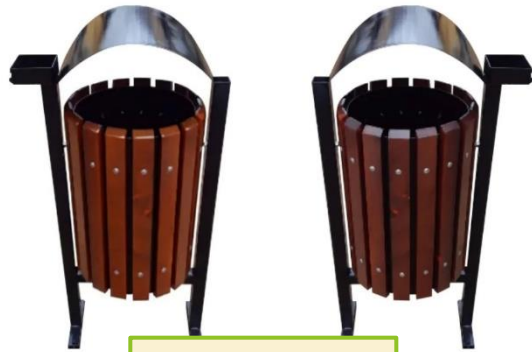
Coșuri de gunoi