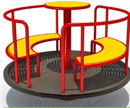
Carusel cu băncuță