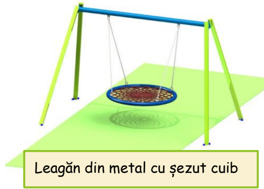
Leagăn din metal cu șezut cuib