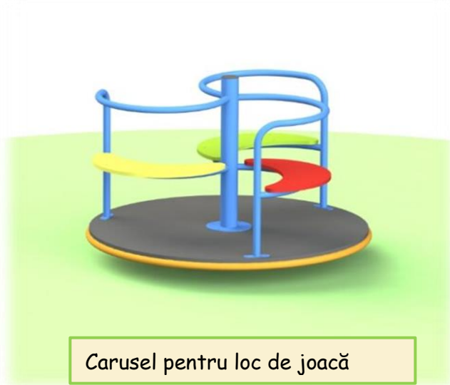
Carusel pentru loc de joacă