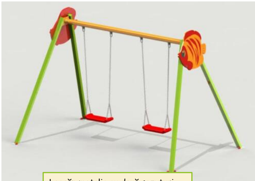
Leagăn metalic cu două șezuturi