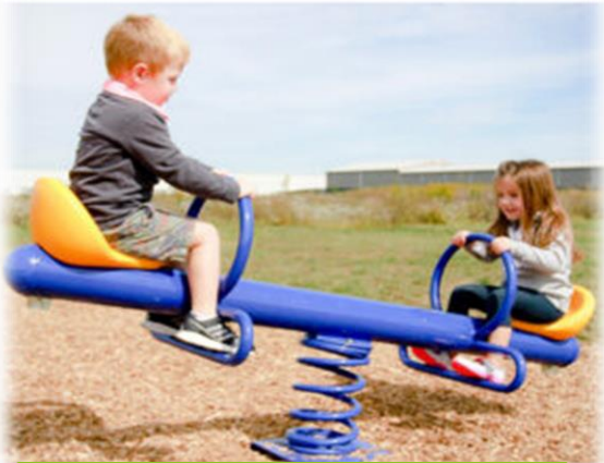
Balansoar pe arc cu două locuri