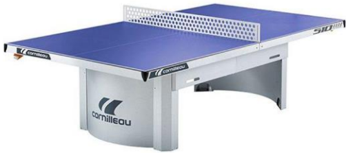
Masă ping-pong exterior