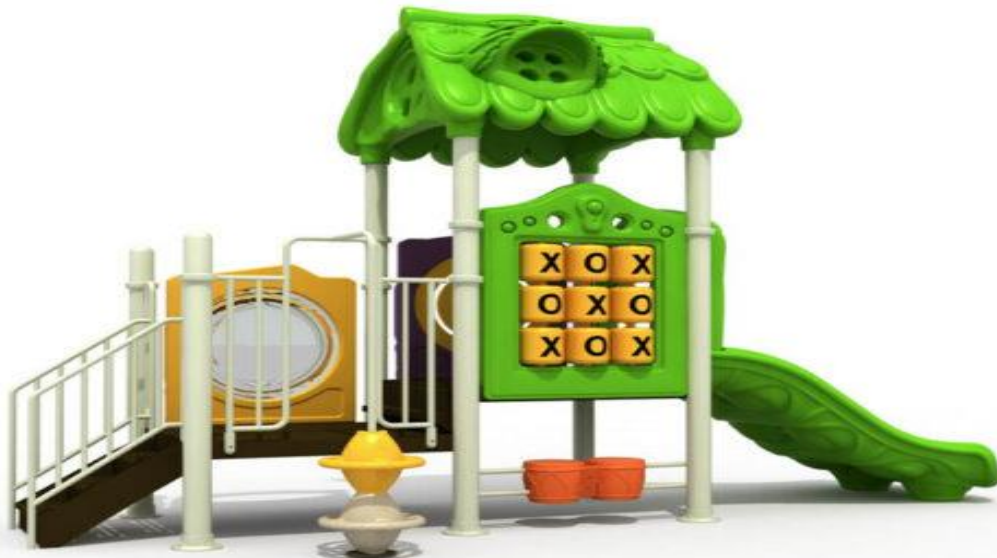
Ansamblu de joacă metalic cu tobogan, cățărătoare și pod