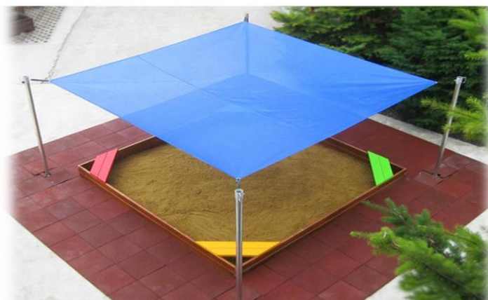
Groapă de nisip pătrată cu acoperiș

Activitatea în afara clasei și extrașcolară oferă numeroase prilejuri pentru cultivarea imaginației, creativității. În parcul amenajat pentru elevi se desfășoară o activitate liberă. Aici se pot exersa diferite metode de stimulare a motricității și a formării deprinderilor, dar și încurajarea colaborării și cooperării între colegi și non-colegi. Promovarea învățării semnificative și plină de satisfacții, prin utilizarea tuturor canalelor senzoriale și stimularea învățării naturale, printr-o abordare ludică este esențială pentru dezvoltarea armonioasă și complexă a elevului.