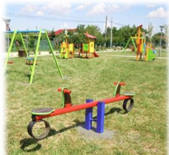
Balansoar din metal cu două locuri