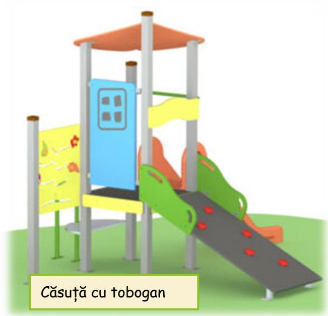
Căsuță cu tobogan