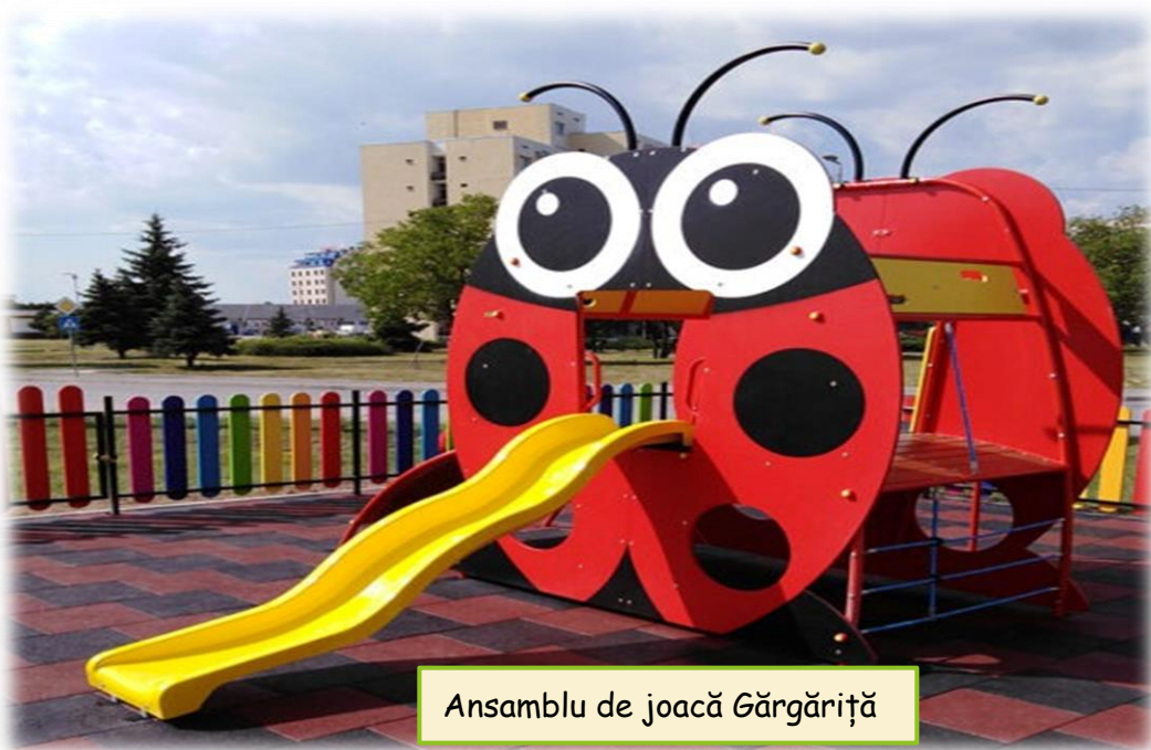
Ansamblu de joacă Gărgăriță