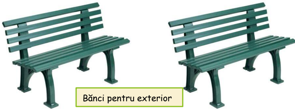
Bănci pentru exterior