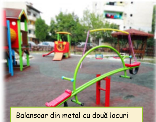
Balansoar din metal cu două locuri